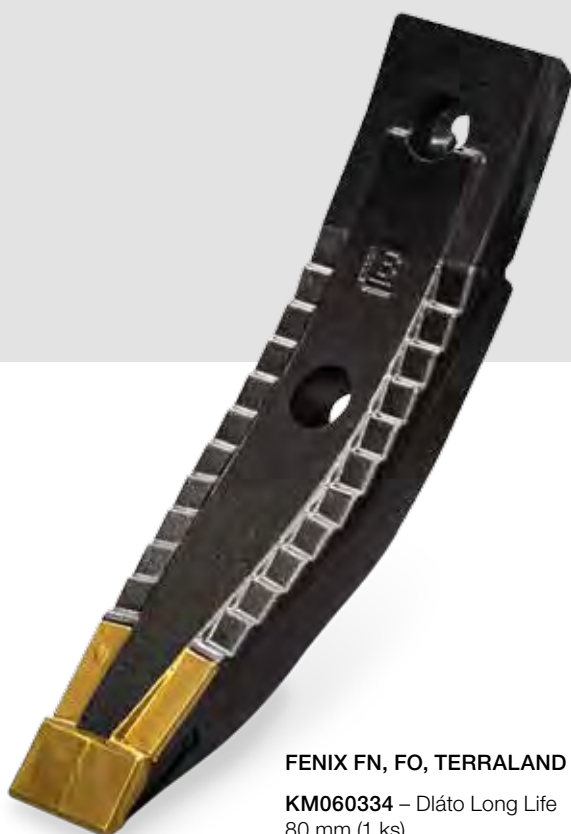
FENIX FN, FO, TERRALAND DO