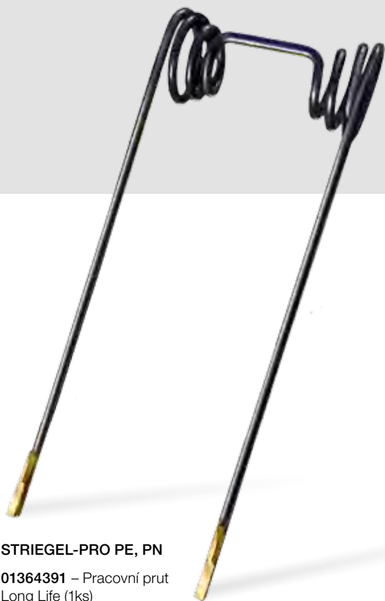
STRIEGEL-PRO PE, PN 01364391 – Pracovní prut Long Life (1ks)