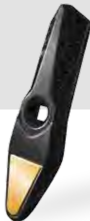
SWIFTER SN, SO, SE, SM KM060416 – Gamma hrot (1 ks)